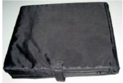
Chi Relax Matte (FIR enhanced)